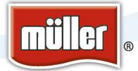
Foto-Nachbericht Meet & Greet mit Andreas Gabalier und Müller von der großen Schlager-Starparade am 19. April in München